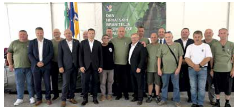
DAN HRVATSKIH BRANITELJA ZAGREBAČKE ŽUPANIJE