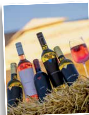
Vinarije članova zaprešićke Udruge vinara Trilikum

Ministarstvo demografije i useljeničtva kroz spomenute pozive nastavlja ulaganja u razvoj lokalnih zajednica te osiguravanje kvalitetnijih uvjeta za odrastanje djece, s posebnim naglaskom na dostupnost predškolskog odgoja, podršku roditeljima i stvaranje sadržaja koji pridonose kvaliteti života obitelji.