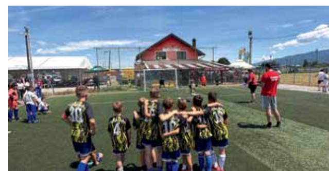
TURNIR CRVENE MAŠINE 2026.