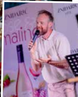
Koncerti su upotpunili vrhunsku atmosferu

Maline s OPG-a Hlačić beru se u neposrednoj blizini, a u kombinaciji s laganim rosé vinom i pažljivo pripremljenim zalogajima, posjetitelji dobivaju cjelovito gastronomsko iskustvo koje se rijetko nudi na jednom mjestu.