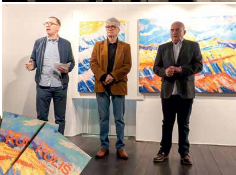
Izložba radova ispunila je Muzej koloritom, ali i posjetiteljima