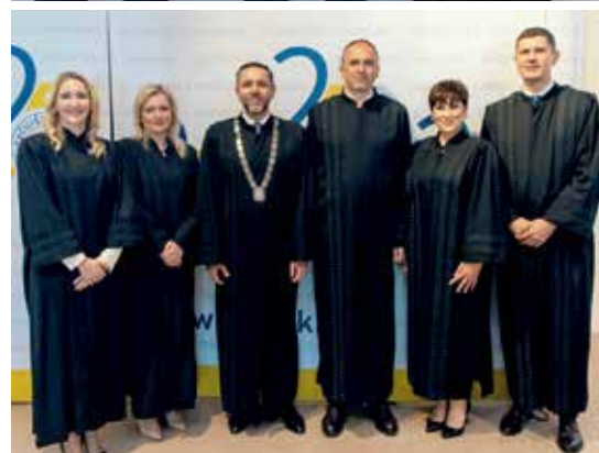
Veleučilište vodi izvrstan tim koji konstantno razvija i modernizira studijske programe