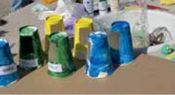
Događanje je objedinilo sve aspekte brige o okolišu i zdravom načinu života