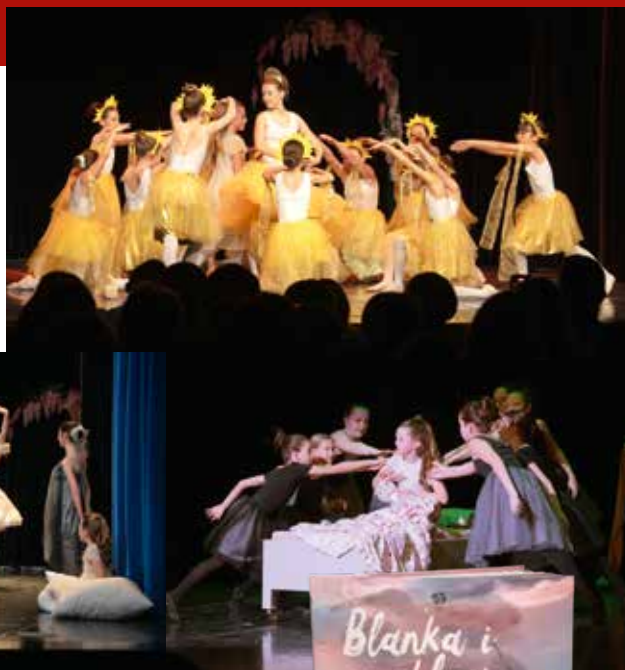
BALET ZA DJECU