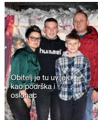
Obitelj je tu uvijek kao podrška i oslonac

“ Kad imate želju, volju i upornost, možete uspjeti u svakom poslu