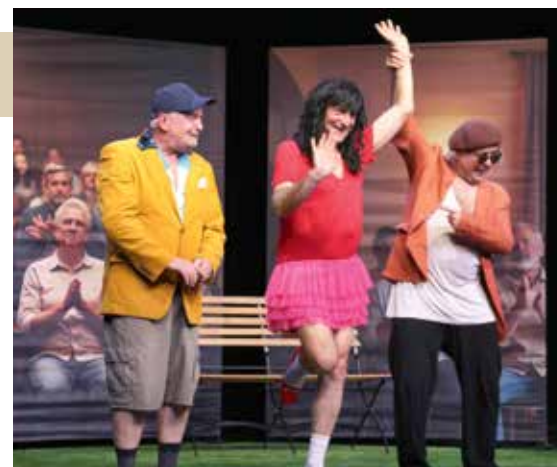
VALENTINOVO U POUZ-U

U sklopu kampanje promovira se i digitalna platforma Europol Help4U koja djeci i mladima pruža mnoštvo informacija, savjeta kao i nužnu podršku te aplikaciju Red Button putem koje građani mogu brzo i jednostavno prijaviti sumnje na online zlostavljanje djece i druge štetne internetske sadržaje.