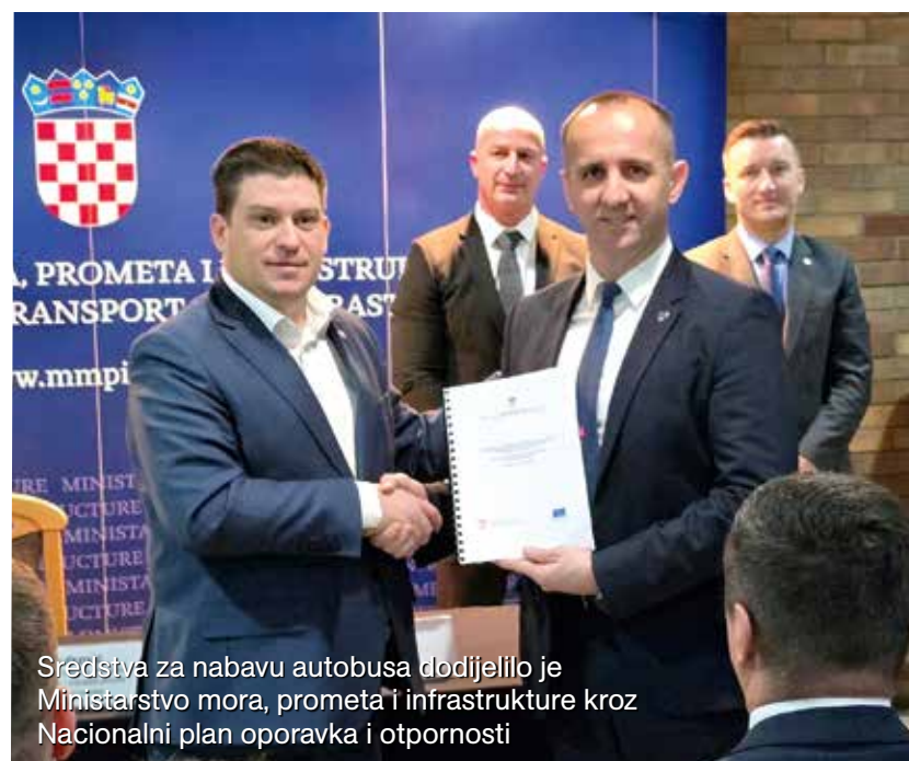
Sredstva za nabavu autobusa dodijelilo je Ministarstvo mora, prometa i infrastrukture kroz Nacionalni plan oporavka i otpornosti

Slijedi usklađivanje linija i autobusnih stajališta te izgradnja infrastrukture potrebne za punjenje električnih autobusa