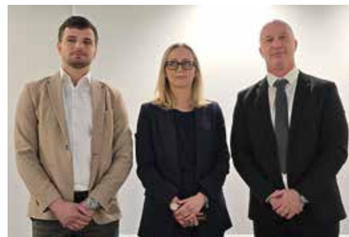
Ugovor su potpisali komunalno poduzeće Zaprešić d.o.o. i društvo WAWA te je time započela realizacija projekta

Mikuš dodavši kako je cilj projekta i smanjenje korištenja osobnih automobila. „Električni autobusi ekološki su prihvatljivi jer ne ostavljaju CO 2 otisak, a prepoznaju li građani prednosti korištenja javnog prijevoza, za očekivati je i da se promet u gradu neće povećavati, unatoč porastu broja automobila. Dugoročno gledano, to znači ukupno smanjenje emisije CO 2 u Zaprešiću“, zaključio je.