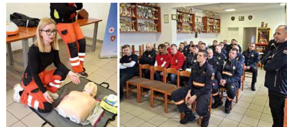
REDOVNA VJEŽBA OPERATIVNIH SNAGA CIVILNE ZAŠTITE

Zaključak skupa može se sažeti jednostavnim porukom: destinacije budućnosti bit će one koje uspiju istovremeno biti zelene, pametne i uključive, a Brežice i Zaprešić to će zasigurno i biti zahvaljujući ENVIRO projektu.