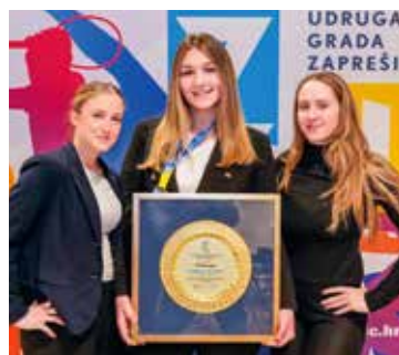
Malim koracima gradi se put do uspjeha