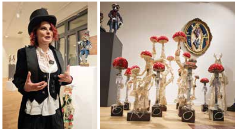
IZLOŽBA STAŠE ŠAHMAN