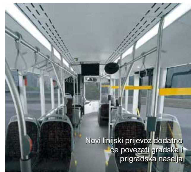
Novi linijski prijevoz dodatno će povezati gradska i prigradska naselja

Usluga će za građane biti potpuno besplatna!