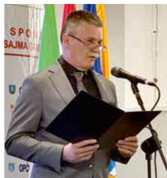
Udruženje obrtnika prati trendove na tržištu

Ponovno nije izostao veliki interes izlagača i posjetitelja