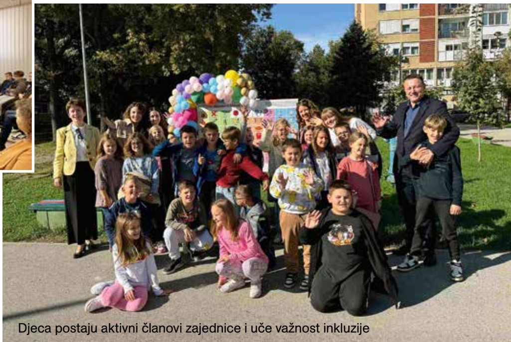
Djeca postaju aktivni članovi zajednice i uče važnost inkluzije

Prvi puni tjedan listopada posvećen je djeci i nazvan Dječji tjedan, a to je tradicionalna godišnja akcija i aktivnost koja obuhvaća sve više djece i odraslih u gradovima i općinama koji imaju status Grada/Općine – prijatelja djece.