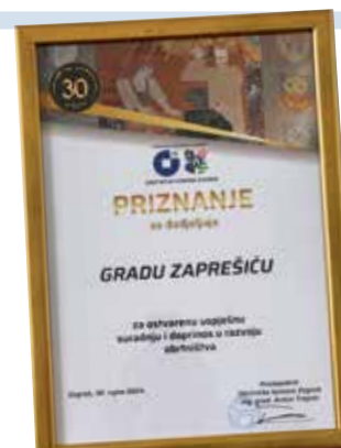
Priznanje je preuzeo zamjenik gradonačelnika Alan Labus