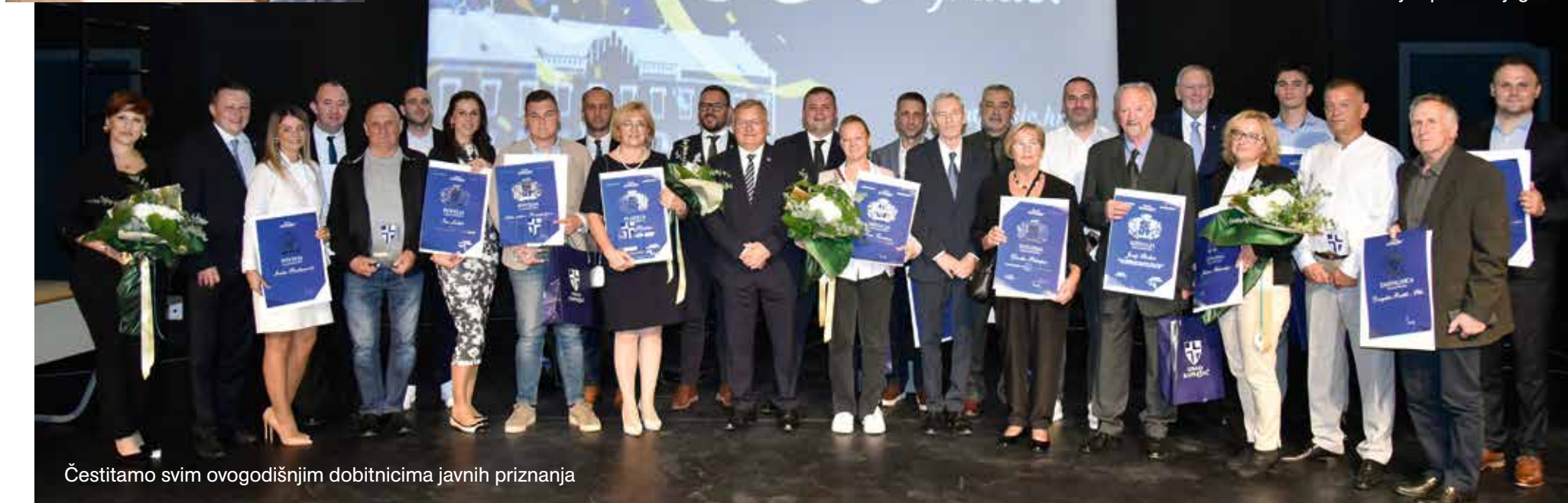
Čestitamo svim ovogodišnjim dobitnicima javnih priznanja

U povodu 29. Dana grada Zaprešića u novoobnovljenoj dvorani Pučkog otvorenog učilišta Zaprešić održana je svečana sjednica Gradskog vijeća na kojoj su nagrađeni oni najzaslužniji koji su postigli iznimne uspjehe.