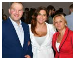
Snaga je u mladima, razum u starima - poruka je susreta

Istaknuta je važnost prijenosa znanja, međugeneracijske solidarnosti i uvažavanja