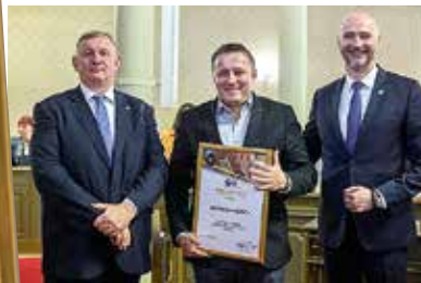
ZAPREŠIĆU PRIZNANJE OBRRTNIČKE KOMORE ZAGREB