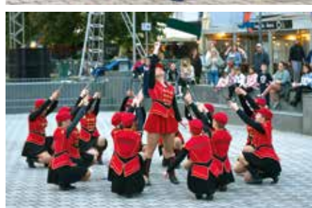
Ritam Zaprešića bio je koncert Jelačićki, Puhačkog orkestra Zaprešić i prijateljskih mažoret ekipa