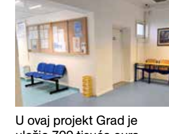
U ovaj projekt Grad je uložio 700 tisuća eura