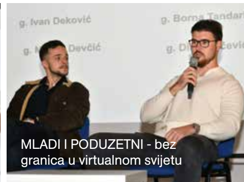
MLADI I PODUZETNI - bez granica u virtualnom svijetu

Istaknuta je važnost prijenosa znanja, međugeneracijske solidarnosti i uvažavanja