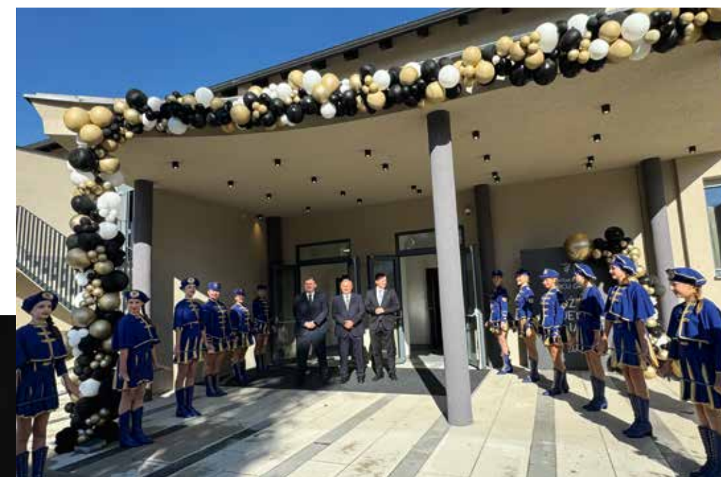
Vjerujemo da će svi laureati nastaviti raditi na razvoju i promociji grada

Gradonačelnik i saborski zastupnik Željko Turk istaknuo je da mu je drago što služi Zaprešiću već 18 godina. „Važno je reći da moji suradnici i ja živimo ovaj naš grad. Ulaganje u obrazovanje, otvorena je ovih dana Osnovna glazbena škola Zaprešić, temeljna je odrednica ulaganja u mlade koji nam onda toliko toga vraćaju kroz izvrsnost u svojim rezultatima, a u projektiranju je i nova osnovna škola te nova sportska dvorana koja Zaprešić još više određuje kao grad sporta“, rekao je Turk dodavši da je „komunalni standard na europskoj razini kao i naša prometna povezanost i prometna rješenja, a most preko Save svakako će zaokružiti našu prometnu priču“. Gradonačelnik je kao nemjerljiv izazov istaknuo obnovu od potresa koja odlično napreduje, kao i obnovu Novih