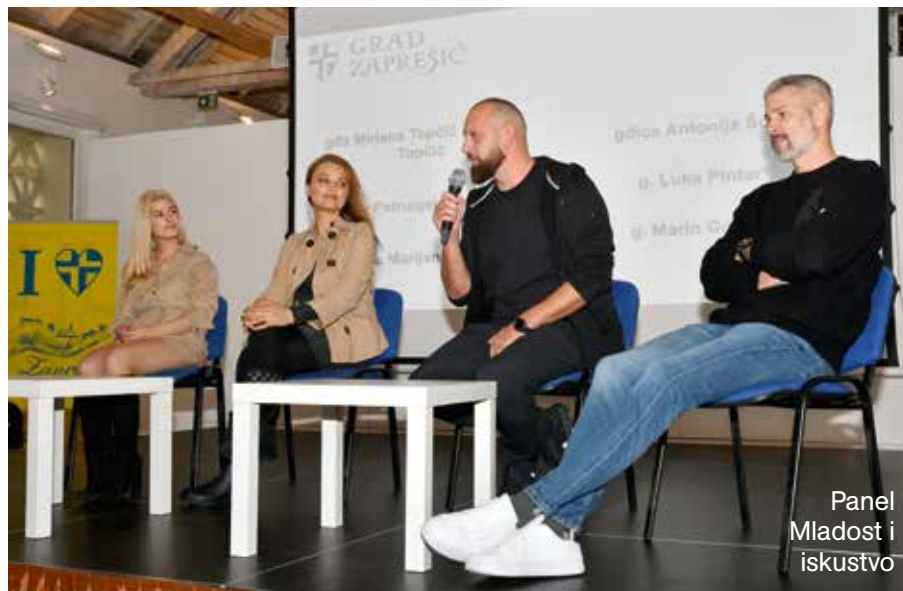
Panel Mladost i iskustvo