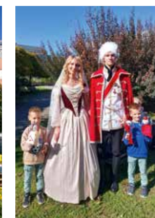
U Pepijevom kutku bilo je puno dječje kreativnosti, plesa i veselog druženja