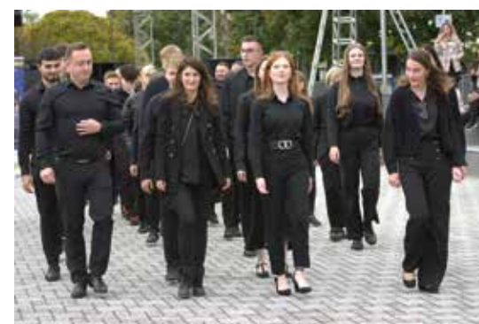
Cjelodnevni program bio je organiziran na glavnom gradskom trgu

Bila je to prava trodnevna proslava 29. rođendana grada Zaprešića u organizaciji Turističke zajednice grada Zaprešića.