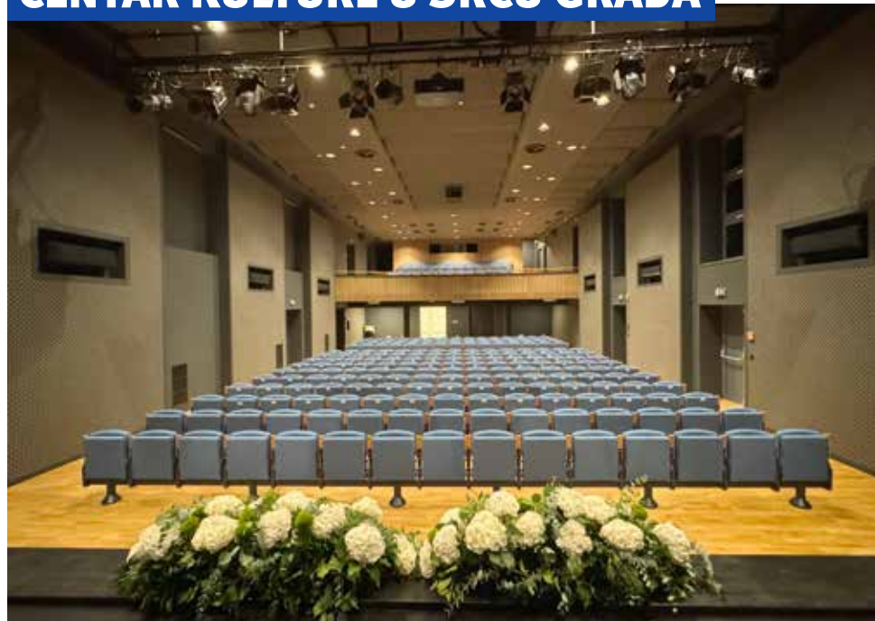
Radovi na obnovi oštećenja od potresa trajali su 2 godine