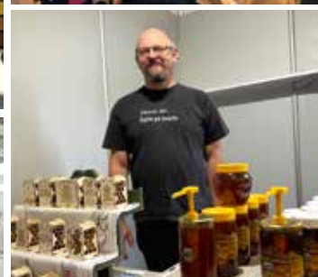
Više od 150 izlagača predstavilo se na ovogodišnjem Sajmu gospodarstva