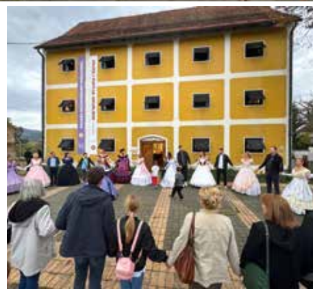
Krinoline su plijenile pažnju prolaznika