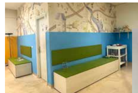
Preuređenje je dobrodošlo malim i velikim pacijentima

Po isteku roka za podnošenje prijava Povjerenstvo će izvršiti bodovanje te objaviti listu stipendista, a svečano potpisivanje ugovora bit će u prosincu nakon objave konačnih rezultata.