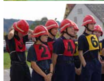
Memorijal je održan jubilarni 20. put

VATROGASNI MEMORIJAL BANA JOSIPA JELAČIĆA