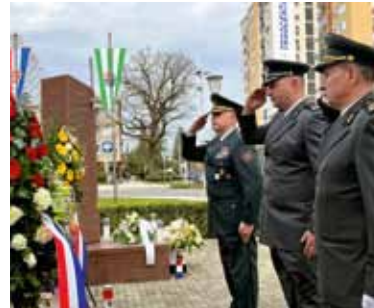
Osim banu, izaslanstvo Ratne škole odalo je počast i poginulim braniteljima Domovinskog rata