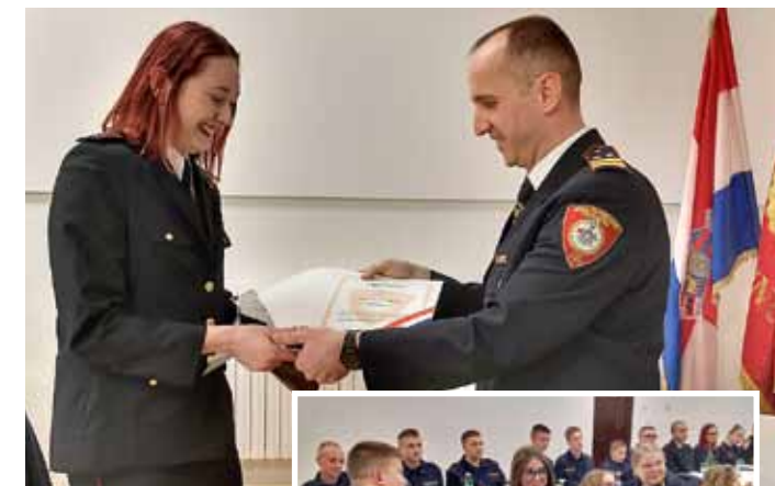
Kupljenski vatrogasci puno ulažu u sigurnost svoga mjesta

Iduće godine priprema se i velika rođendanska proslava budući da će DVD Ivanec proslaviti svoj 70. rođendan.