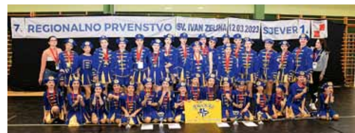
„JELAČIČKE“ ODUŠEVILE NA REGIONALNOM PRVENSTVU