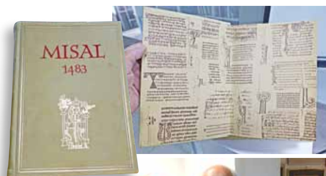
Rad na promicanju i očuvanju hrvatske baštine