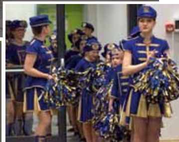
Kad se male ruke slože, sve se može