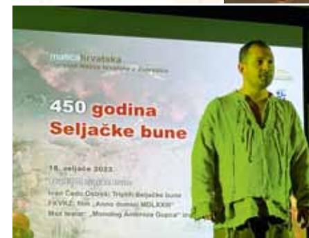
Glumac Jadran Grubišić oživio je Matiju Ambroza Gupca