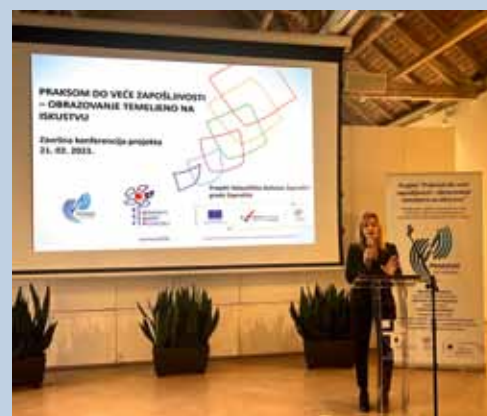
PROJEKT PRAKSOM DO VEĆE ZAPOŠLJIVOSTI

Dan bolesnika prigodno je obilježio Dom zdravlja Zagrebačke županije, Ispostava Zaprešić, organiziranjem akcije mjerenja šećera u krvi i tlaka na 4 lokacije. Uključile su se i učenice Škole za medicinske sestre Vinogradska koje svoju praksu odrađuju u zaprešićkom Domu zdravlja.