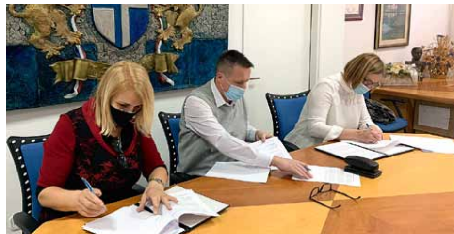
ZAPOČEO PROJEKT DIGITALIZACIJE UPISA U DJEČJE VRTIĆE

sufinancira i Zavod za javno zdravstvo Zagrebačke županije. Zaprešić ovim pilot-projektom na razini Zagrebačke županije postaje jedini grad u regiji koji ima ovakvo praćenje na razini predškolskog i osnovnoškolskog odgoja i obrazovanja.