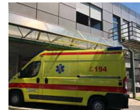
POTPISANI SU UGOVORI ZA DODATNI TIM HITNE POMOĆI I NABAVU NOVOG DEFIBRILATORA

Tako će od sljedeće godine osim nove zgrade vrtića u Ulici K. Š. Gjalskog, izgradnjom koje će se povećati upisne kvote, Zaprešić imati i novi način upisa vrtićke djece.