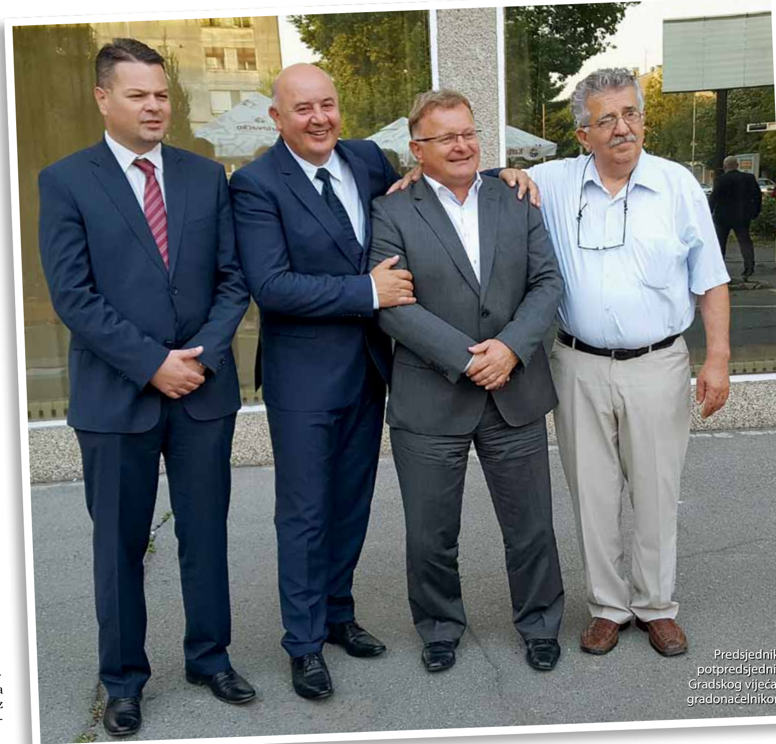
Predsjednik i potpredsjednici Gradskog vijeća s gradonačelnikom

“ Ne treba se obazirati na to je li neki prijedlog došao iz oporbe ili od strane vladajućih, ako je dobar prijedlog, treba raditi na tome da se prihvati!