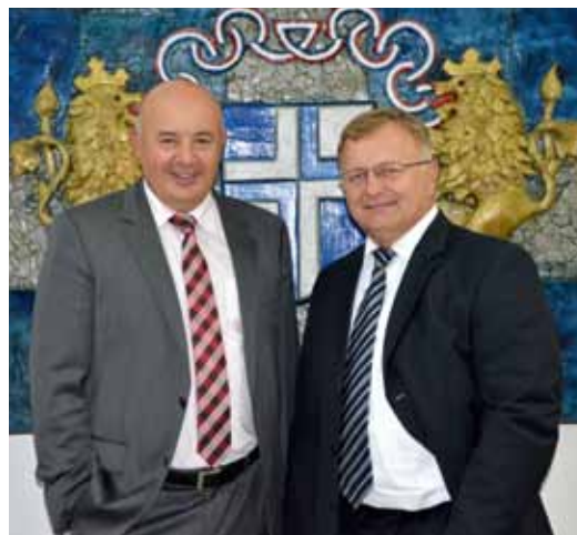
Suradnja između izvršne i zakonodavne vlasti bila je na zavidnoj razini

Politički možda uvođenje naplate parkiranja na području grada. Ne zbog nekih naših nedoumica, mi smo poslušali prijedlog struke i vjerujem da i danas naši