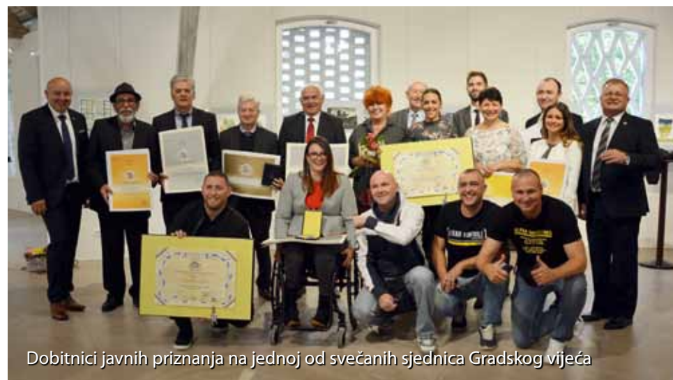
Dobitnici javnih priznanja na jednoj od svečanih sjednica Gradskog vijeća

vota u našem gradu. Potvrda da smo u tome i uspjeli je priznanje gradu da je treći grad srednje veličine po kvaliteti života u Hrvatskoj.