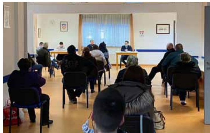
Stanari su zahvalili Gradu na brznoj pomoći, a gradonačelnik Željko Turk rekao je kako će i u narednom razdoblju biti uz njih i pratiti daljnje korake.

Tema je bila i izrada elaborata za koji su svi stanari izabrali izrađivača, a Grad je na sebe preuzeo financiranje. Taj će elaborat dati ocjenu postojećeg stanja zgrade te odrediti daljnje mjere i postupke.