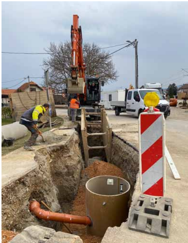
Radovi postavljanja cijevi u Ulici Pere Devčića u kojoj je za cestovni promet zatvoren željezničko-cestovni prijelaz